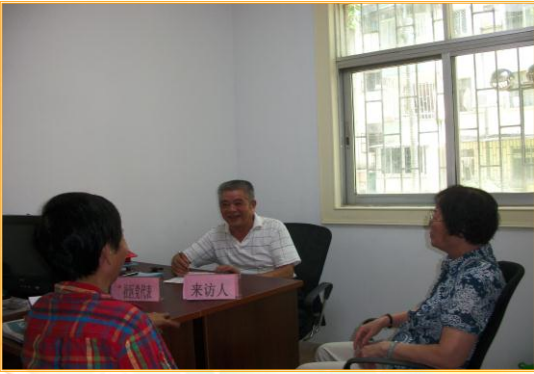
老党员为居民排忧解难